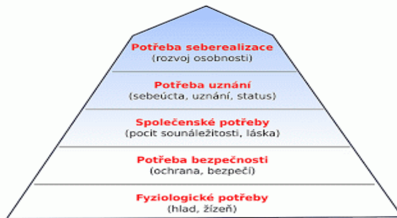
Obr. 1. Maslowova hierarchie potřeb

Rodina je prvním místem, v němž se jedinec podrobuje sociálnímu učení, ale je také považována za hlavního činitele, který při svém selhávání dětem umožňuje závadné a kriminální chování (Matoušek, Matoušková, 2011).